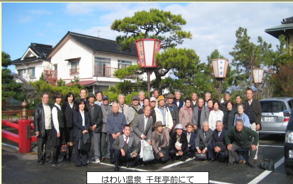
はわい温泉 千年亭前にて