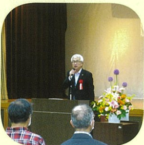
福井新温泉町商工観光課長